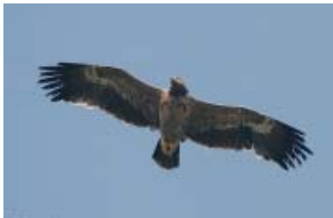
Steppeørn 2K, Borreby Mose (S), 8/10 2005. Steppe Eagle .