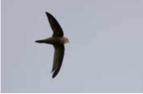
Gråsejler 1K, Skagen Nordstrand (NJ), 7/11 2005. Pallid Swift .