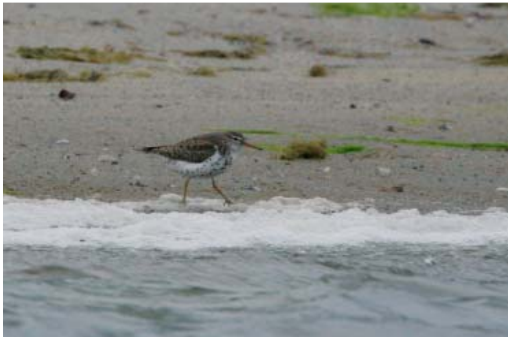
Plettet Mudderklire 3K+ sommerdragt, Ølseagle Revle (S), 10/8 2005. Ny art for Danmark. Spotted Sandpiper .

før 1950; 2) antal anerkendte og SU-godkendte fund og individer fra og med 1950 til og med 2004; 3) antal godkendte fund og individer i 2005. Denne opdeling er i overensstemmelse med den standard, der anbefales af AERC (Association of European Rarities Committees). Bemærk i øvrigt, at antal fund ikke altid er identisk med antal individer, idet flokke og par regnes som enkeltfund, mens f.eks. fem enkeltindivider på én dag regnes som 5 fund. I lighed med europæisk standard regnes ynglefund (inkl. unger) som ét fund, mens samme tilbagevendende individ over flere år regnes for flere fund.