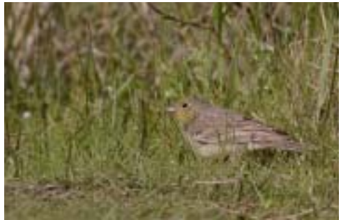
Gulgrå Værling, ssp. semenowi , 2K ♂, Skagen (NJ), 29/5 2005. Cinereous Bunting .

Høgeugle Surnia ulula (ca 30/30, 37/37 ud over invasionen i 1983/84, 2/2)