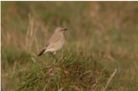
Isabellastenpikker, Nyeng, Skallingen (RB), 13/10 2005. Isabelline Wheatear .