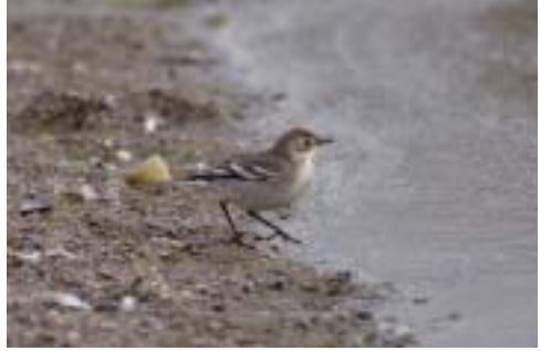
Citronvipstjert 1K, Sydvestpynten, Amager (S), 6/10 2005. Citrine Wagtail .