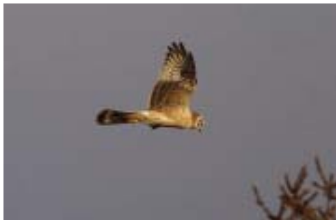
Steppehøg 2K ♂, Skagen (NJ), 25/4 2005. Pallid Harrier .