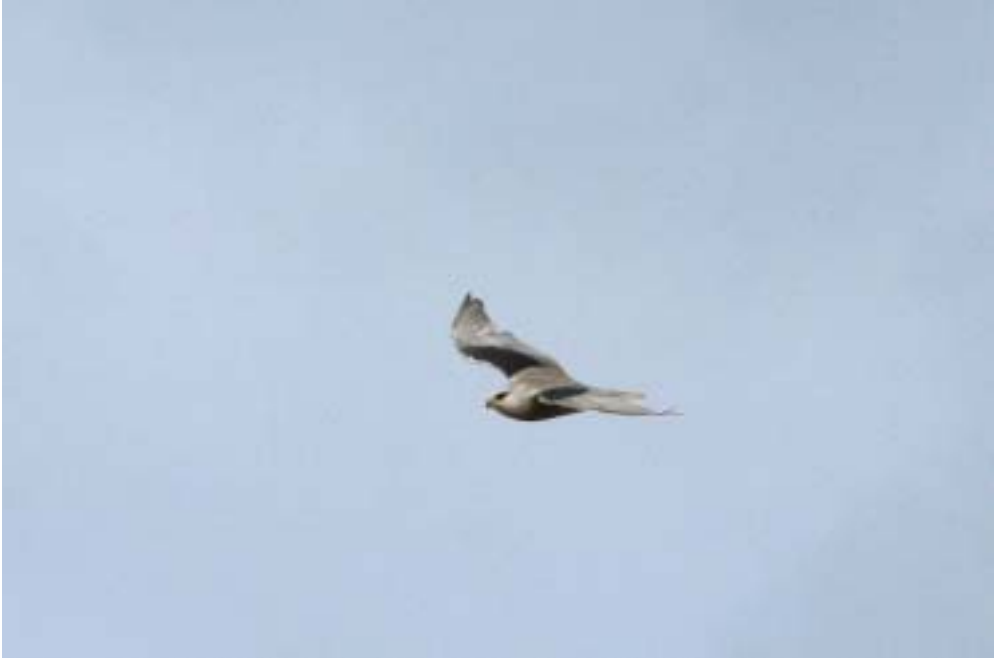
Blå Glente ad., Skagen (NJ), 16/5 2005. Andet danske fund. Black-winged Kite.

stedreservatet, Dværgørn på Stevns, samt i alt seks Stribede Ryler, fem Damklirer og to Tereklirer.