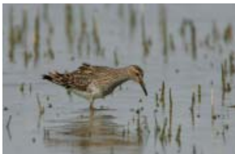
Stribet Ryle 2K+, Vodskov (NJ), 16/4 2005. Pectoral Sandpiper .

Fuglene ved Kjul Strand og Skagens Gren 21/5 regnes som samme individ. Forekomsten af Steppehøg i Danmark betragtes nu som veldokumenteret, hvorfor arten er udgået af SU-listen fra og med 2006. (Østeuropa og Centralasien; overvintrer tropisk Østafrika, Lilleasien og Indien)