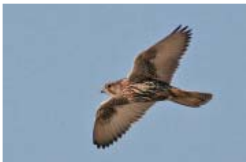
Jagtfalk 1K, Gedser Odde (LF), 30/10 2005. Gyr Falcon .